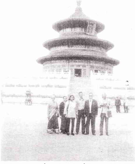
टॅम्पल ऑफ हेवन

त्यांच्या बेजिंगभेटीचा हा वृत्तान्त. - संपादक