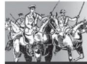
हुतात्मा मंगल पांडे